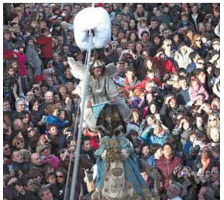
UN INSTANTE, DOS VERSIONES En ambas fotos se ve el instante central de la Bajada del Ángel: la retirada del velo que cubre el rostro de la Virgen.