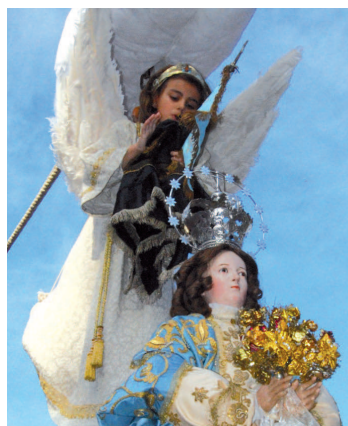
El Ángel retira el velo negro