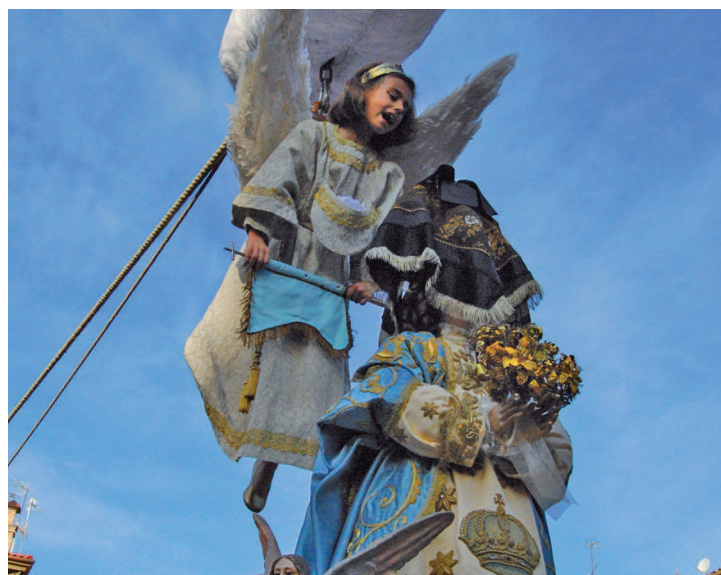
El Ángel anuncia a María la Resurrección